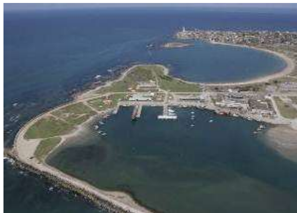
Vista aérea de La Paloma, Bahía Grande a la izquierda y vista del puerto a la derecha.