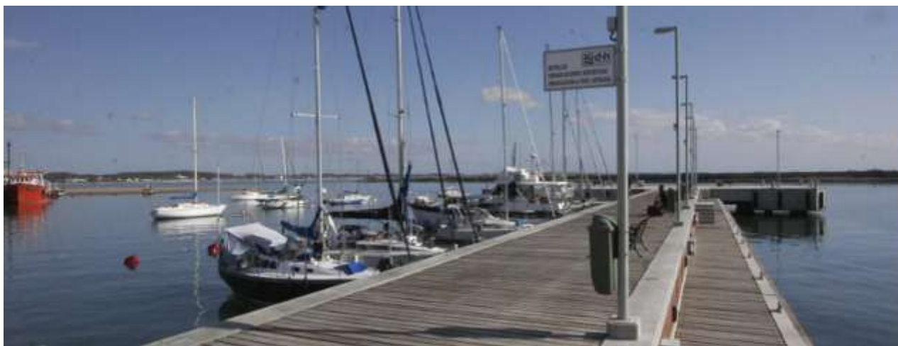
Muelle nuevo en el puerto.

El puerto La Paloma es estratégico para la navegación de embarcaciones a vela de travesía. La falta de servicios e infraestructura adecuada hacen que el puerto se utilice principalmente como refugio ante condiciones meteorológicas desfavorables. Si se continuaran mejorando sus instalaciones, se convertiría fácilmente en un importante puerto de recalada para travesías turísticas y deportivas en el Atlántico Sur y para el desarrollo de otros deportes náuticos.