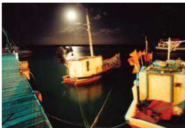
Muelle viejo, Puerto La Paloma. Foto: Diego García